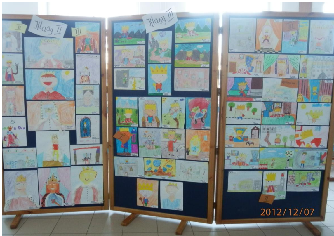
Wystawa prac uczniów